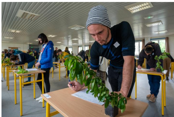
Illustration des épreuves régions concours en salle